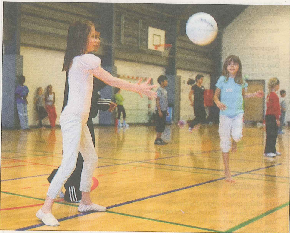
Flere og flere børn inspireres af kidsvolley til at melde sig ind i Volleyball Vestsjælland.